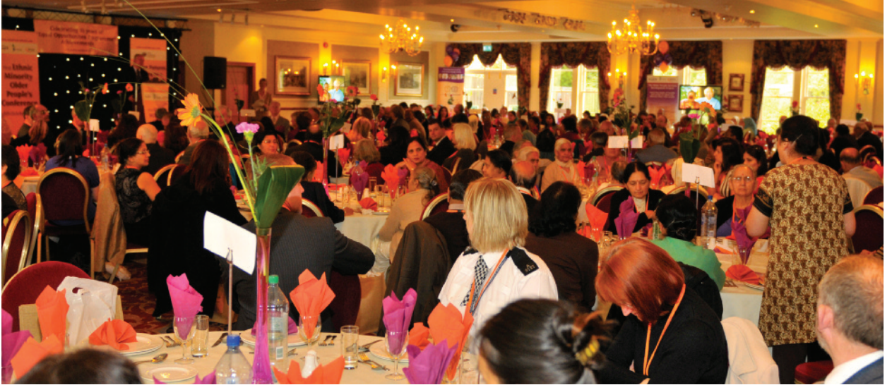
सम्मेलन में अतिथि